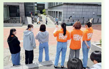
2024年5月26日 「初夏のオープンキャンパス」