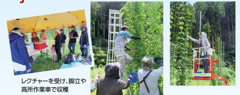
レクチャーを受け、脚立や高所作業車で収穫

2023年7月17日(月)海の日には、イシノマキ・ファームが栽培している石巻市北上町の白浜ホップファームにてオリジナルクラフトビールの原料となるホップの収穫体験を実施しました。同窓会から参加者を募り同窓生13名が参加し、脚立や高所作業車に乗ってホップの収穫体験を楽しみました。この日に同窓生が実際に収穫したホップを使って、オリジナルクラフトビールは製作されました。