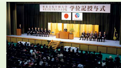
2024年3月15日「学位記授与式」