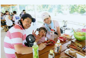
ホップ収穫後は参加者でBBQも開催!