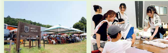
探求・理解プロジェクト「輝ける者」の実践として 2023年8月5日・6日 秋保ワイナリーにてクラフトパレマルシェを開催