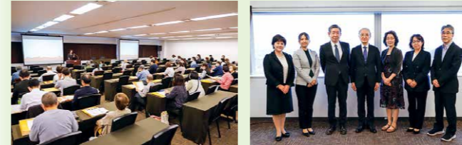
2023年10月8日 東北文化学園大学フォーラム「健やかな未来のために～言語聴覚士・視能訓練士・眼科医が語る秘訣～」