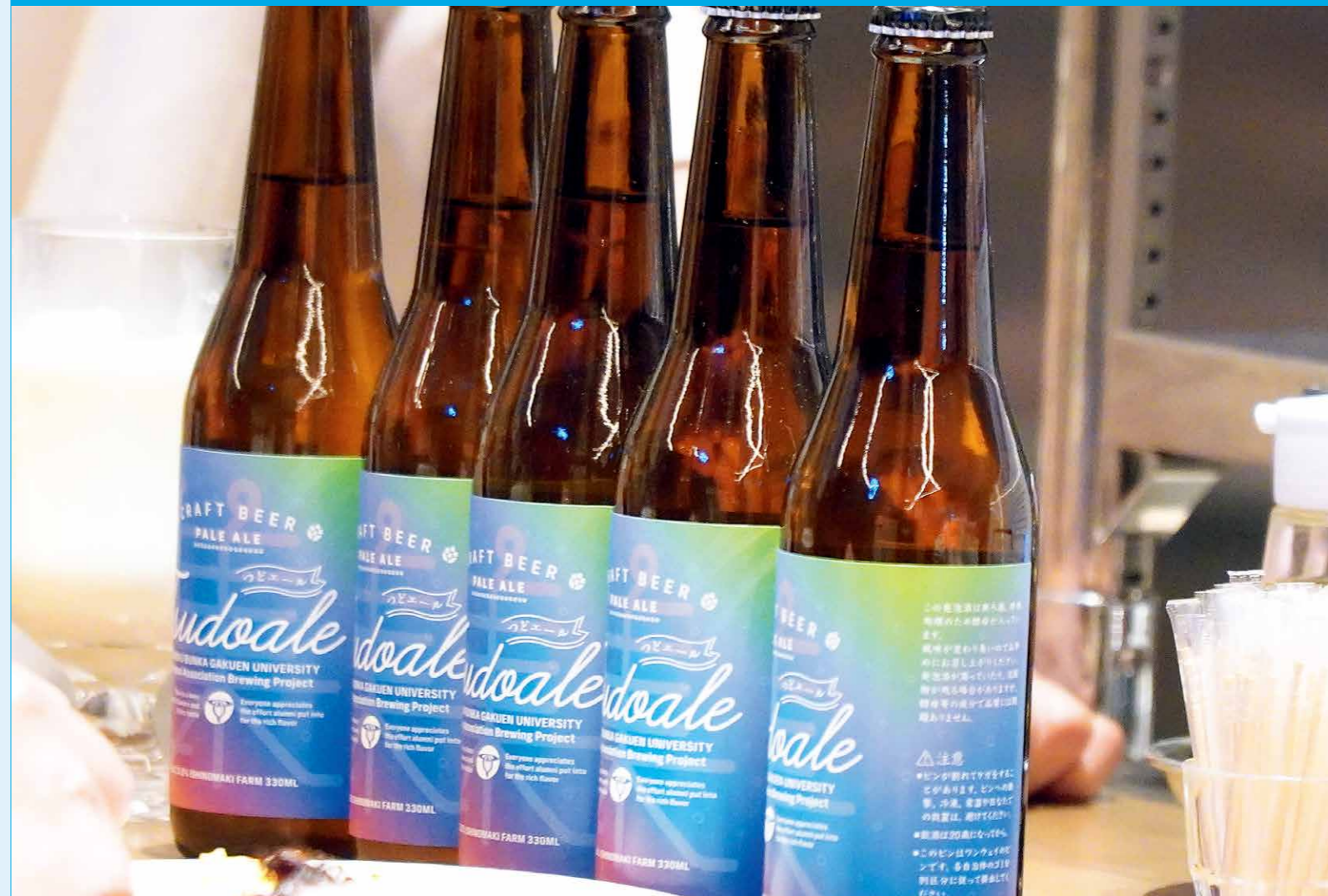
東北文化学園大学同窓会20周年記念 オリジナルクラフトビール